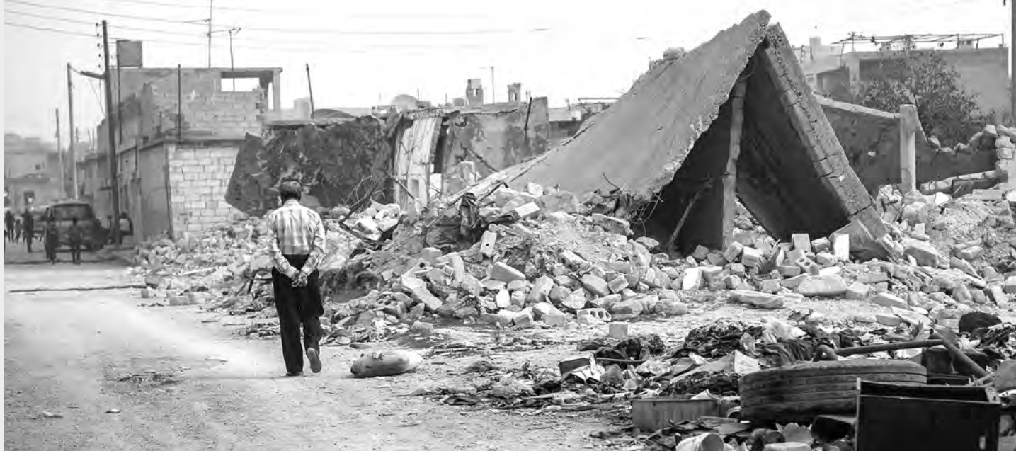
Alto grado de daños, destrucción y desplazamiento en Aleppo. Fotografía: ACNUR/Antwan Chnkaji, octubre de 2018

Turquía y Rusia negociaron un acuerdo el 17 de septiembre para establecer una zona desmilitarizada entre 14 y 19 kilómetros de ancho a lo largo de la línea de contacto y que se extiende a las zonas nororientales rurales de Latakia. La policía militar de Turquía se ha estacionado para vigilar su cumplimiento, que incluye la retirada de todos los armamentos pesados. El acuerdo puede haber evitado un desastre humanitario por ahora, pero los informes de violaciones cometidas por todas las partes causan preocupación. 98 Se debería desarrollar la estabilidad inicial que ha introducido a fin de establecer una solución más duradera que realmente proteja a la población civil de Idlib.