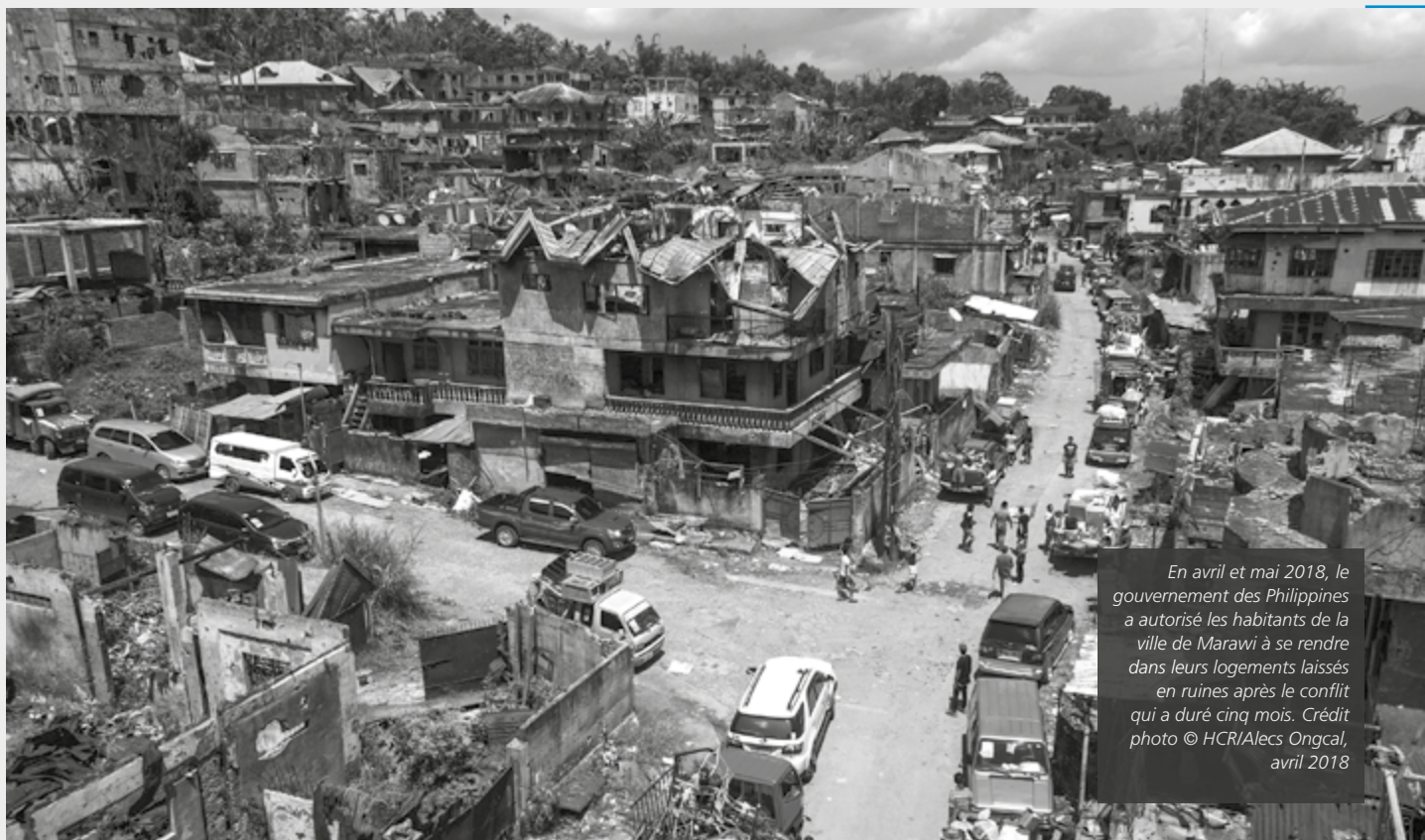
En avril et mai 2018, le gouvernement des Philippines a autorisé les habitants de la ville de Marawi à se rendre dans leurs logements laissés en ruines après le conflit qui a duré cinq mois. Crédit photo © HCR/Alecs Ongcal, avril 2018

a été complètement détruit. 148 L'armée a escorté les habitants pour récupérer ce qu'ils pouvaient des décombres de leurs maisons avant que la zone ne soit bouclée. Elle demeure inhabitable et la reconstruction ne commencera pas tant que les débris n'auront pas été nettoyés et les routes reconstruites, ce qui devrait prendre au moins 18 mois. 149