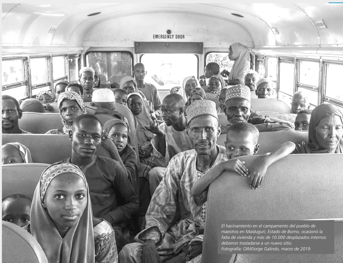
El hacinamiento en el campamento del pueblo de maestros en Maidugurí, Estado de Borno, ocasionó la falta de vivienda y más de 10.000 desplazados internos debieron trasladarse a un nuevo sitio. marzo de 2019

de manejo de emergencias han estado respondiendo a la crisis. Por ejemplo, la Agencia de gestión de emergencias del estado de Plateau ha estado proporcionando alimento y agua a los desplazados internos albergados en campamentos en el estado, pero aún se reportan carencias. 65 Los residentes de los campamentos se quejan del hacinamiento y la falta de agua. Más del 60 por ciento de los desplazados en la región son niños que no asisten a la escuela. 66 Se brindó una respuesta internacional significativa a la situación de desplazamiento en el noreste, pero ninguna presencia internacional importante participa en la respuesta a la crisis que se desarrolla en la región del cinturón medio. 67