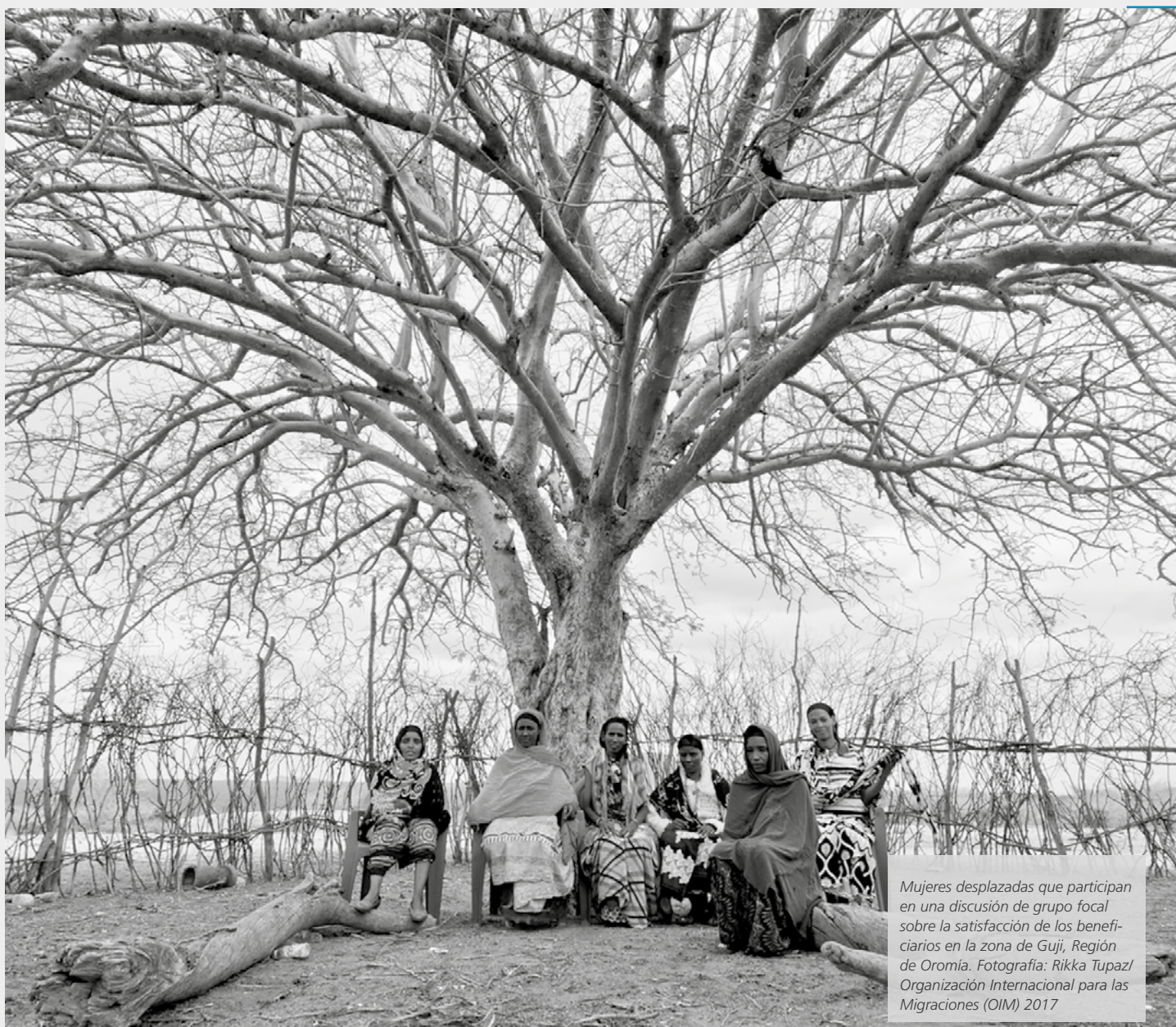
Mujeres desplazadas que participan en una discusión de grupo focal sobre la satisfacción de los beneficiarios en la zona de Guji, Región de Oromía. Fotografía: Rikka Tupaz/ Organización Internacional para las Migraciones (OIM) 2017

las afueras de Adís Abeba en septiembre, cuando jóvenes oromo acudieron a la capital para recibir a los combatientes del Frente de Liberación Oromo que regresaban de Eritrea, desplazaron 15.000 personas. 46